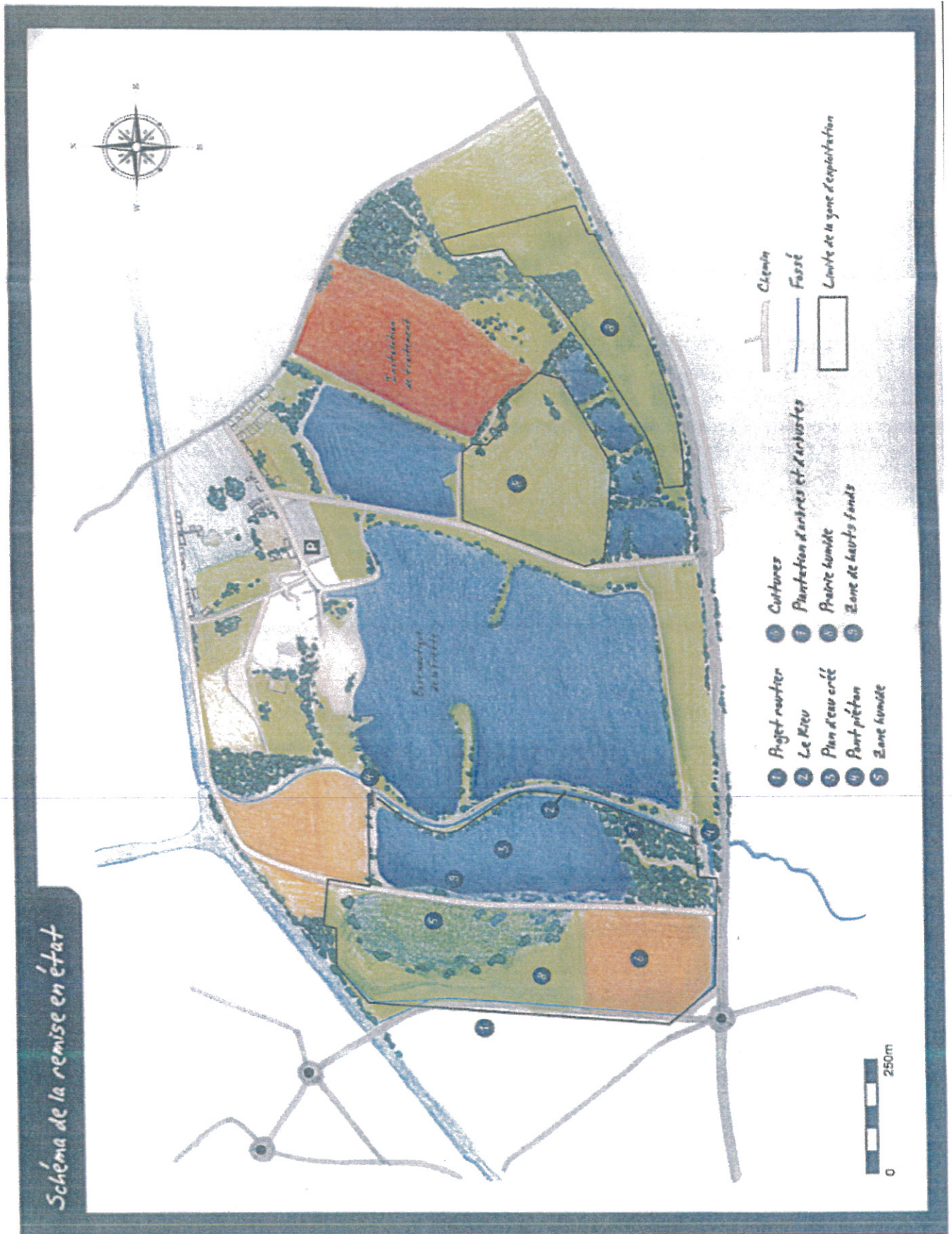
Schéma de la remise en état