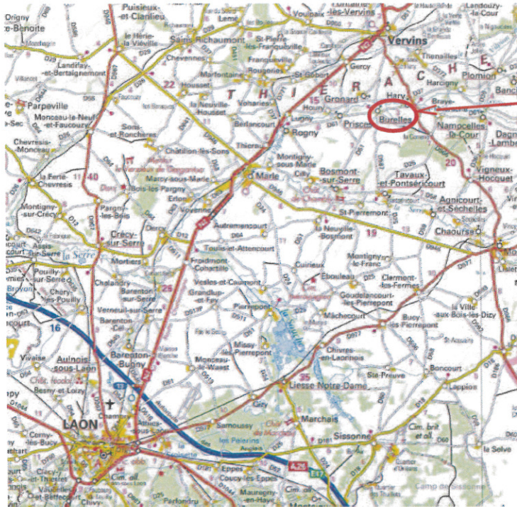
Localisation de Burelles