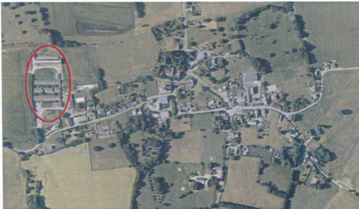
Position des bâtiments par rapport au village