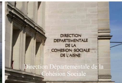
Direction Départementale de la Cohésion Sociale