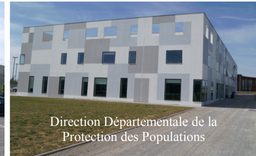
Direction Départementale de la Protection des Populations