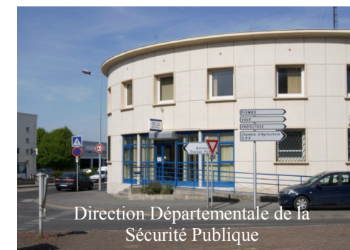
Direction Départementale de la Sécurité Publique