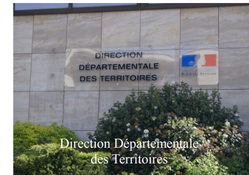
Direction Départementale des Territoires