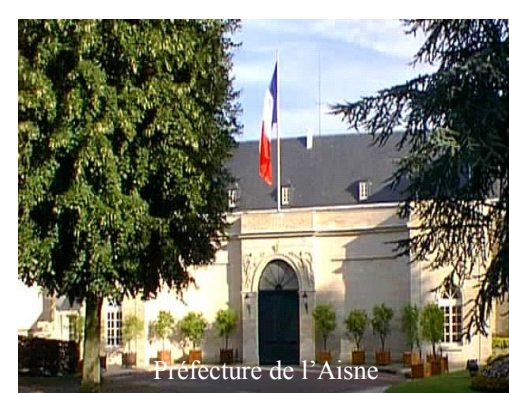
Préfecture de l'Aisne