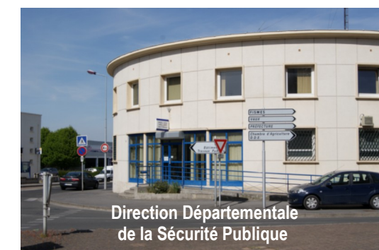
Direction Départementale de la Sécurité Publique

Préfecture de l'Aisne Service départemental de la communication interministérielle 2 rue Paul Doumer – CS 20656 – 02010 Laon Cedex ☎ 03.23.21.82.15 ✉ pref-communication@aisne.gouv.fr