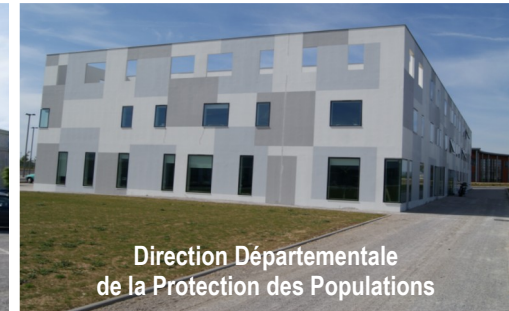
Direction Départementale de la Protection des Populations