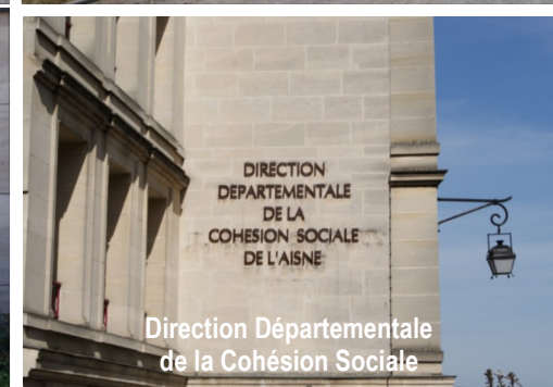
Direction Départementale de la Cohésion Sociale