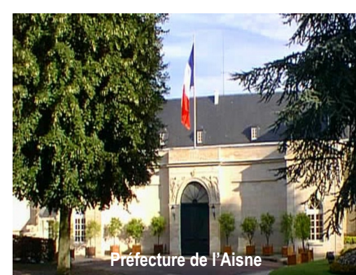
Préfecture de l'Aisne