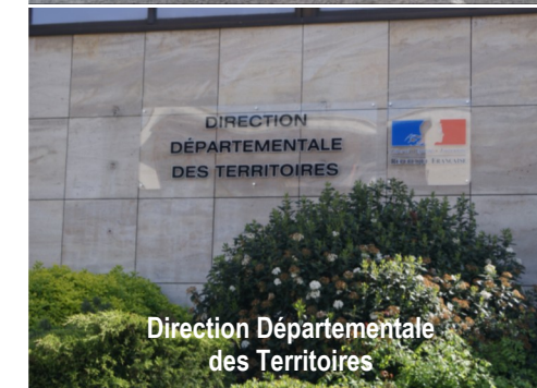
Direction Départementale des Territoires